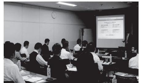
セミナー・勉強会の風景