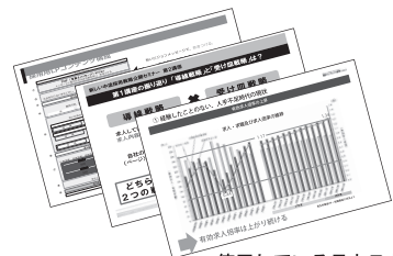
使用しているテキストの一部

3ヶ月に1度、採用研究会を弊社会議室又は商工会議所にて開催します。課題や解決方法の共有、また事例紹介による「使える事例」を共有します。また、indeedの動向や求職者動向に関する最新情報などをご案内していきます。